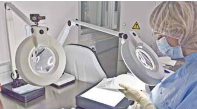
Gestión de calidad