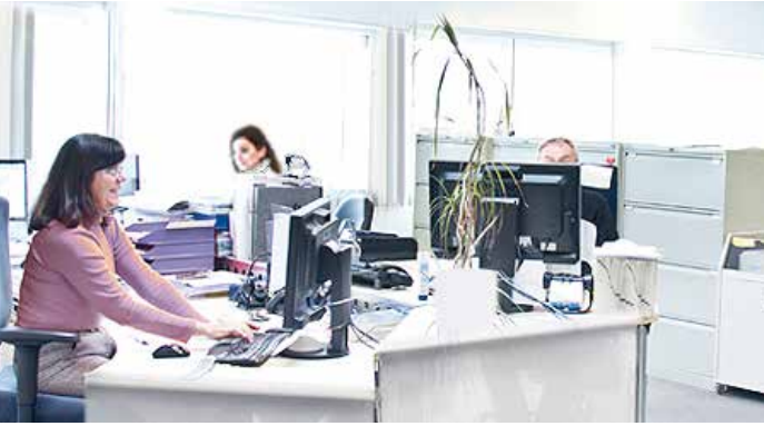
Servicio al cliente