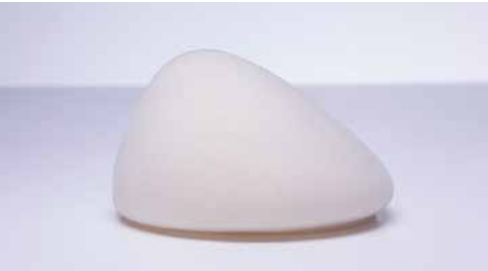
Desarrollo de productos